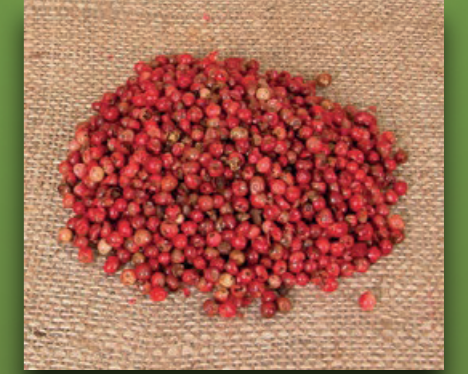
Kırmızı Karabiber Red Black Pepper Red Schwarzer Pfeffer