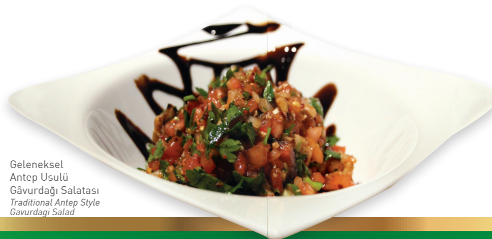
Geleneksel Antep Usulü Gâvurdağı Salatası Traditional Antep Style Gavurdağı Salad