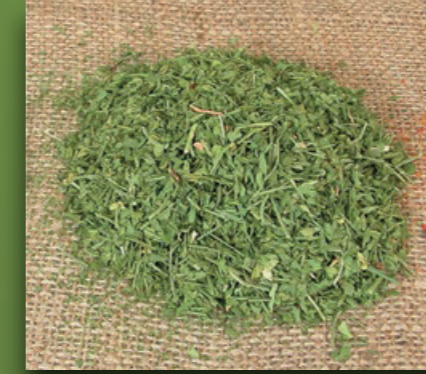
Maydanoz Parsley Petersilie