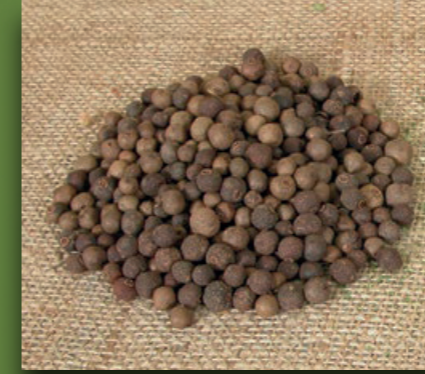
Kisnis Coriander Koriander